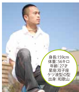
身長:159cm 体重:56kg 年齢:27才 星座:双子座 ケツ液型:O型 出身:和歌山

バックする時は Condom つける。とかですね。 ——最後に一言お願いします。これからGOGOする機会も増やしていきたいし、色々な事に挑戦したいと思っていますので、堂山で見かけたらよろしく願いします!